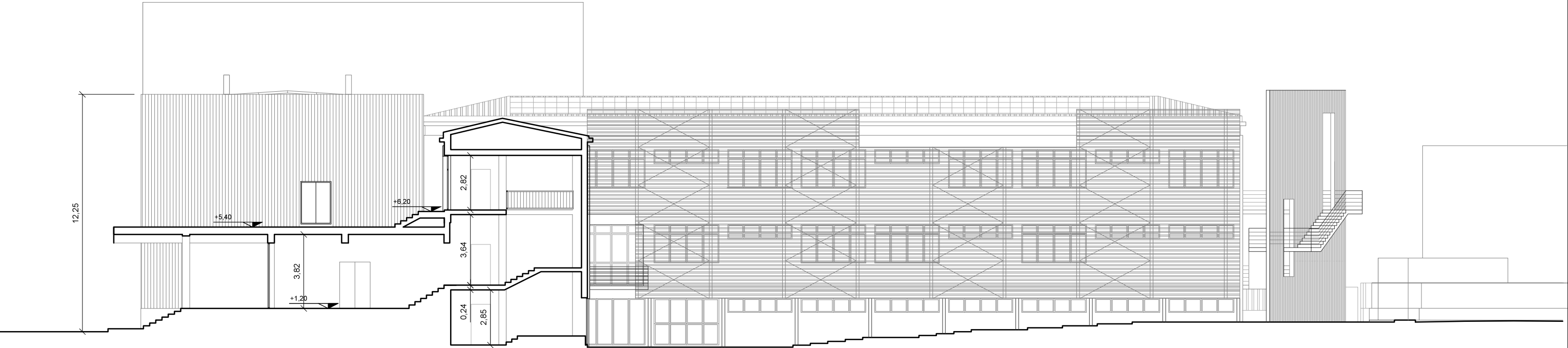
Sezione B - B'