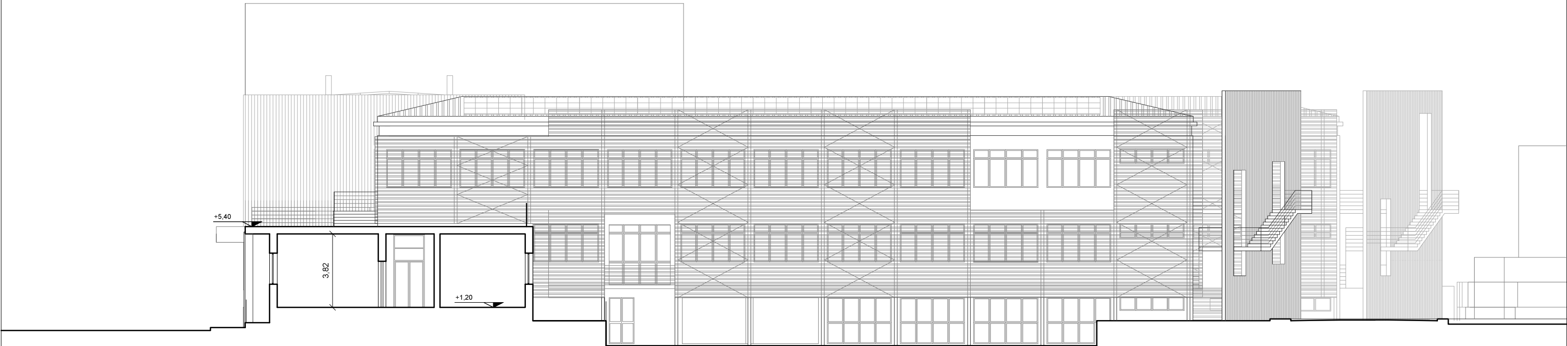
Sezione C - C'